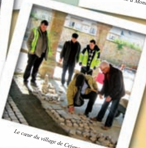
Le cœur du village de Ceignac en travaux.

Stéphanie, l'animatrice de la commune, propose des activités pour tous.