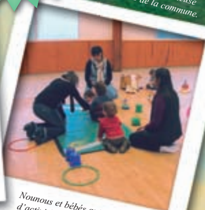
Nounous et bébés autour d'activités d'éveil.