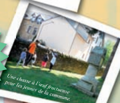
Une chasse à l'œuf fructueuse pour les jeunes de la commune.

Stéphanie, l'animatrice de la commune, propose des activités pour tous.