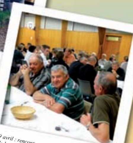
9 avril : rencontre des 3 Comités d'Animation de la commune.