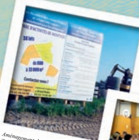
Aménagement de la nouvelle Zone Artisanale à Montvert.