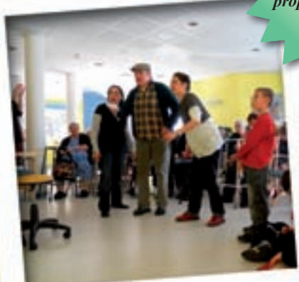
Rencontre intergénérationnelle autour de la Wii.

Vie Communale Finances Vie Associative Informations pratiques