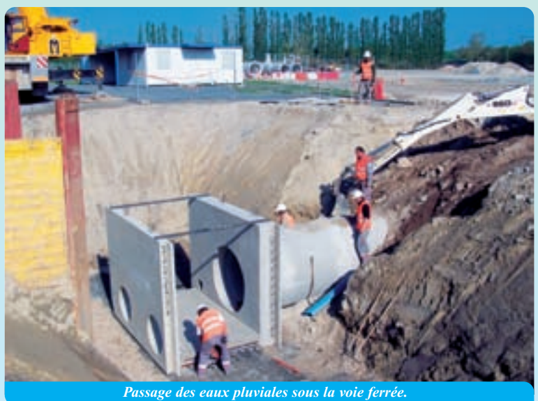
Passage des eaux pluviales sous la voie ferrée.