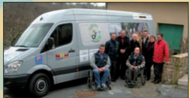
Le minibus de l'espoir (p.8)