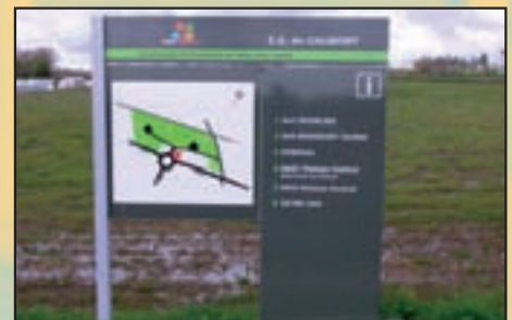
Totems signalant la Zone Artisanale de Calmont