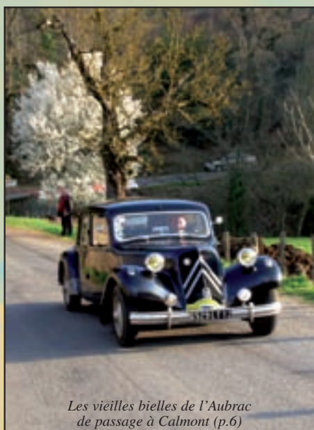
Les vieilles bielles de l'Aubrac de passage à Calmont (p.6)