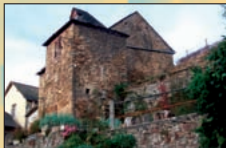
L'ancienne "Maison Rivière" à Calmont deviendra un gîte rural communal