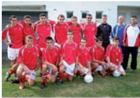
Les moins de 18 ans d'Espoir Foot 88.