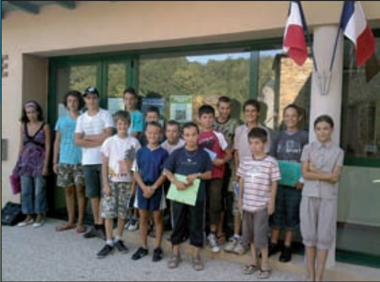
Les 15 nouveaux élus du Conseil Municipal d'Enfants