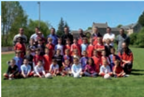
Les Très Jeunes de l'Ecole de Foot

La journée des « Très Jeunes » (débutants et poussins) a clôturé l'année sportive -