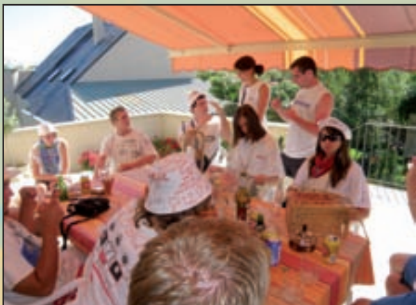
Ceignac : l'aubade des conscrits en août