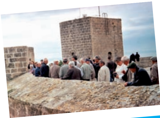
Voyage aux Baléares (printemps 2009)