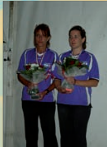
Sport Quilles Magrin Parlan : les féminines, 3ème au championnat de France et championnes en honneur