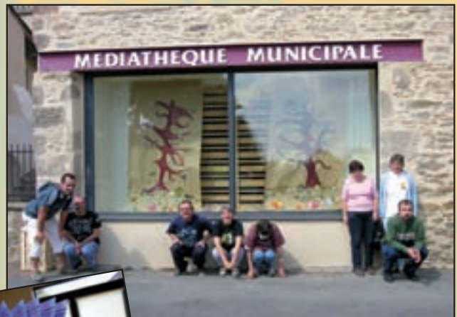
Les résidents de l'E.S.A.T. de Ceignac devant leurs créations pour la Médiathèque Municipale