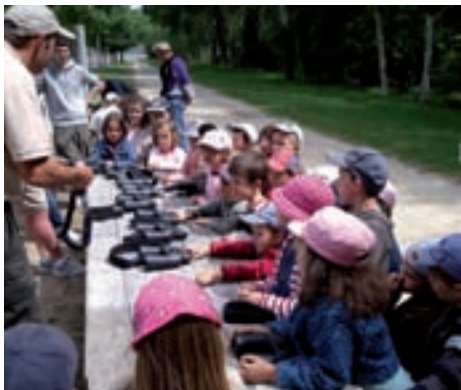
Intervention de la Fédération Départementale de Chasse avec les élèves de Magrin (découverte de la faune)

La nouvelle année scolaire débute avec des projets culturels, sportifs et environnementaux. Les effectifs du regroupement sont cette année de 116 enfants à la rentrée.