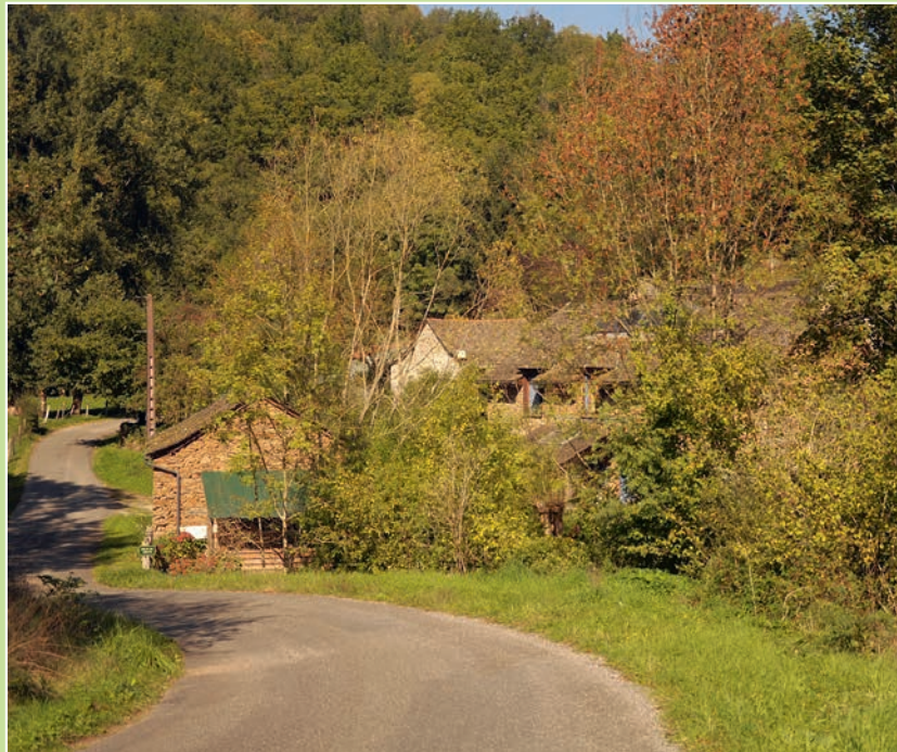
Hameau de la Verderie.