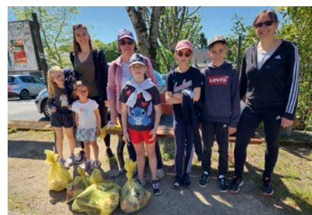
Journée citoyenne du 17 mai sur la Commune.